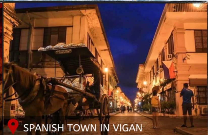
SPANISH TOWN IN VIGAN