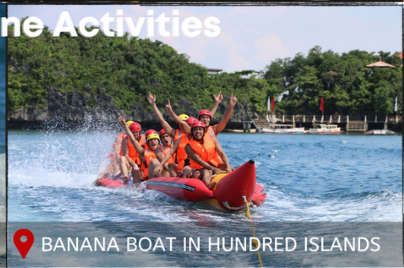
BANANA BOAT IN HUNDRED ISLANDS