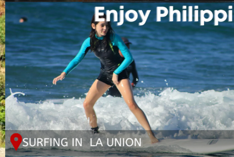
SURFING IN LA UNION