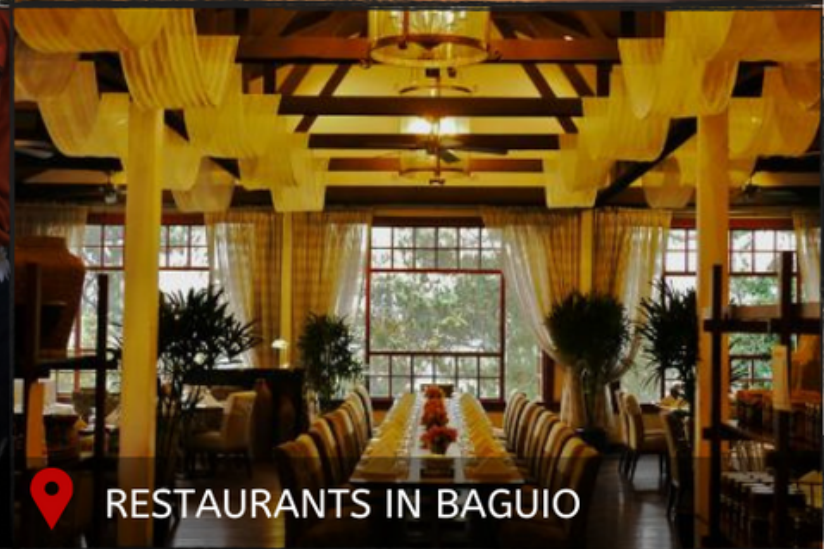
RESTAURANTS IN BAGUIO