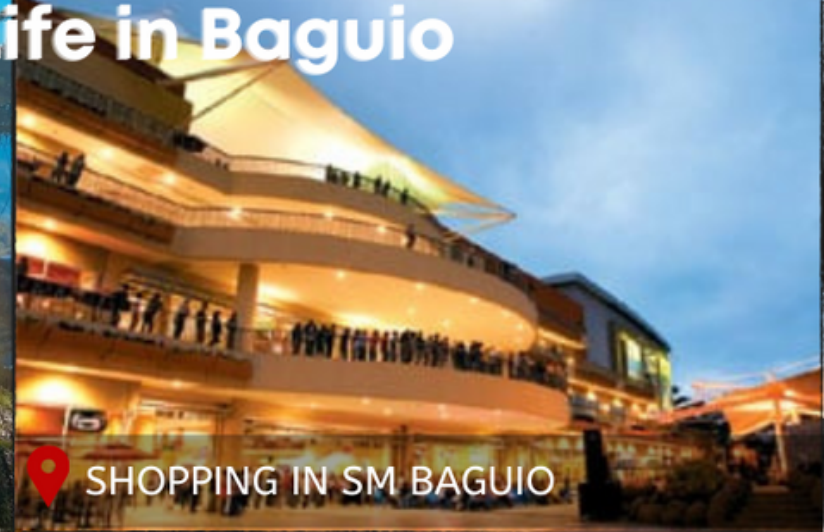
SHOPPING IN SM BAGUIO