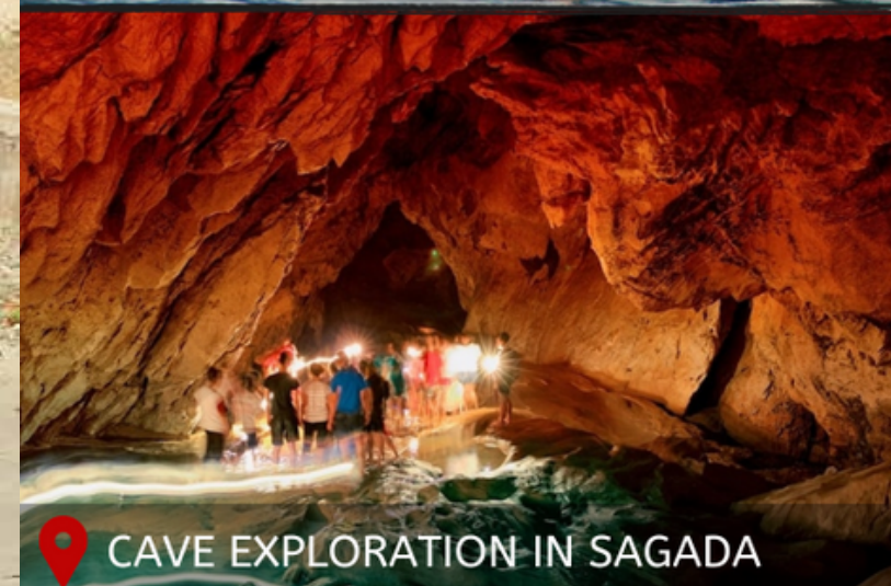
CAVE EXPLORATION IN SAGADA