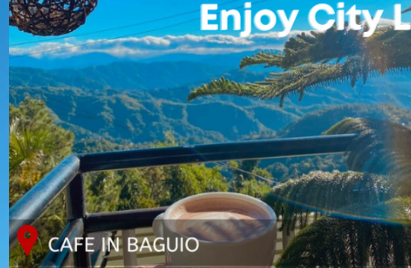
CAFE IN BAGUIO