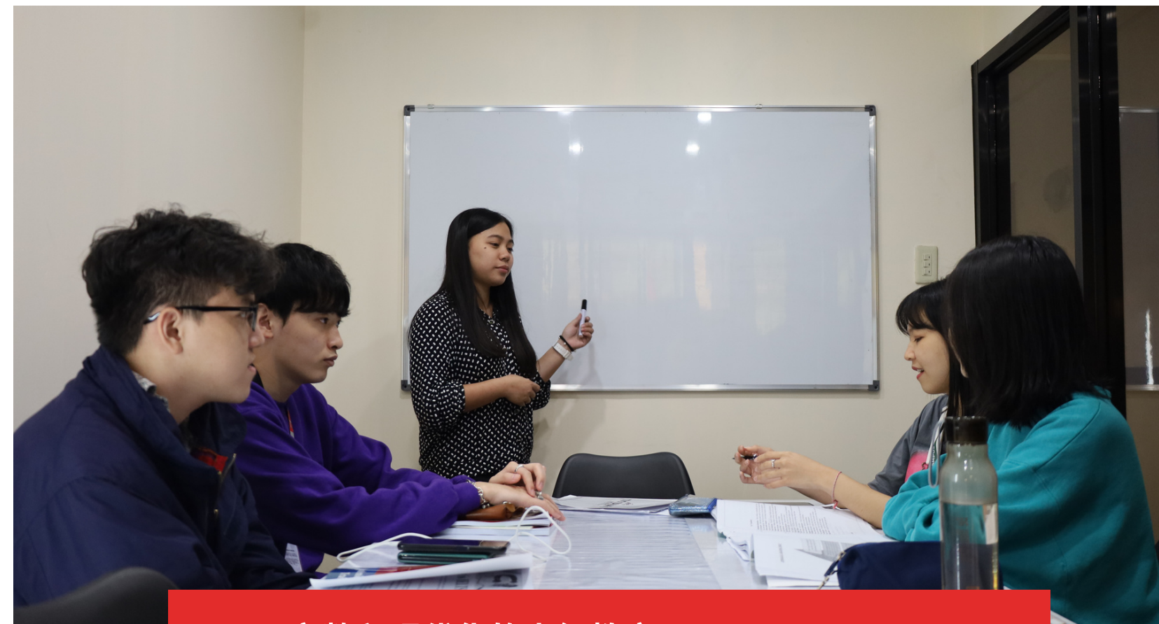
寬敞和現代化的小組教室